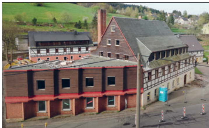
vor dem Abriss