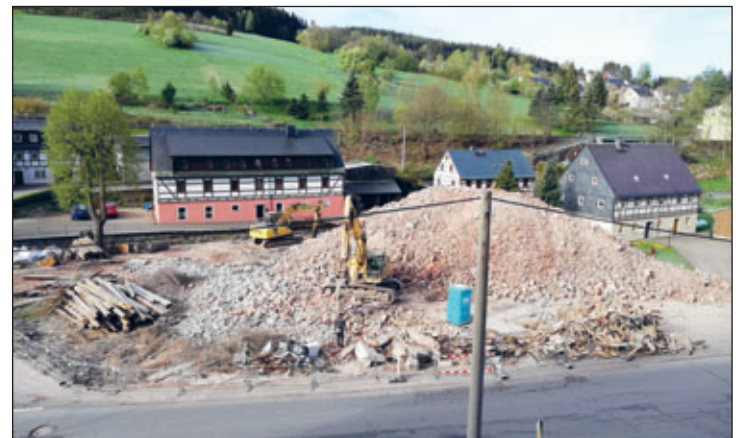
nach dem Abriss