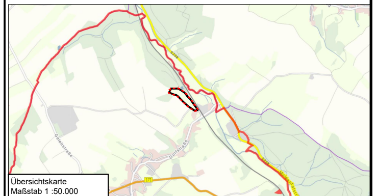
Übersichtskarte Maßstab 1 :50.000

Rechenberg-Bienenmühle den ..... Bürgermeister