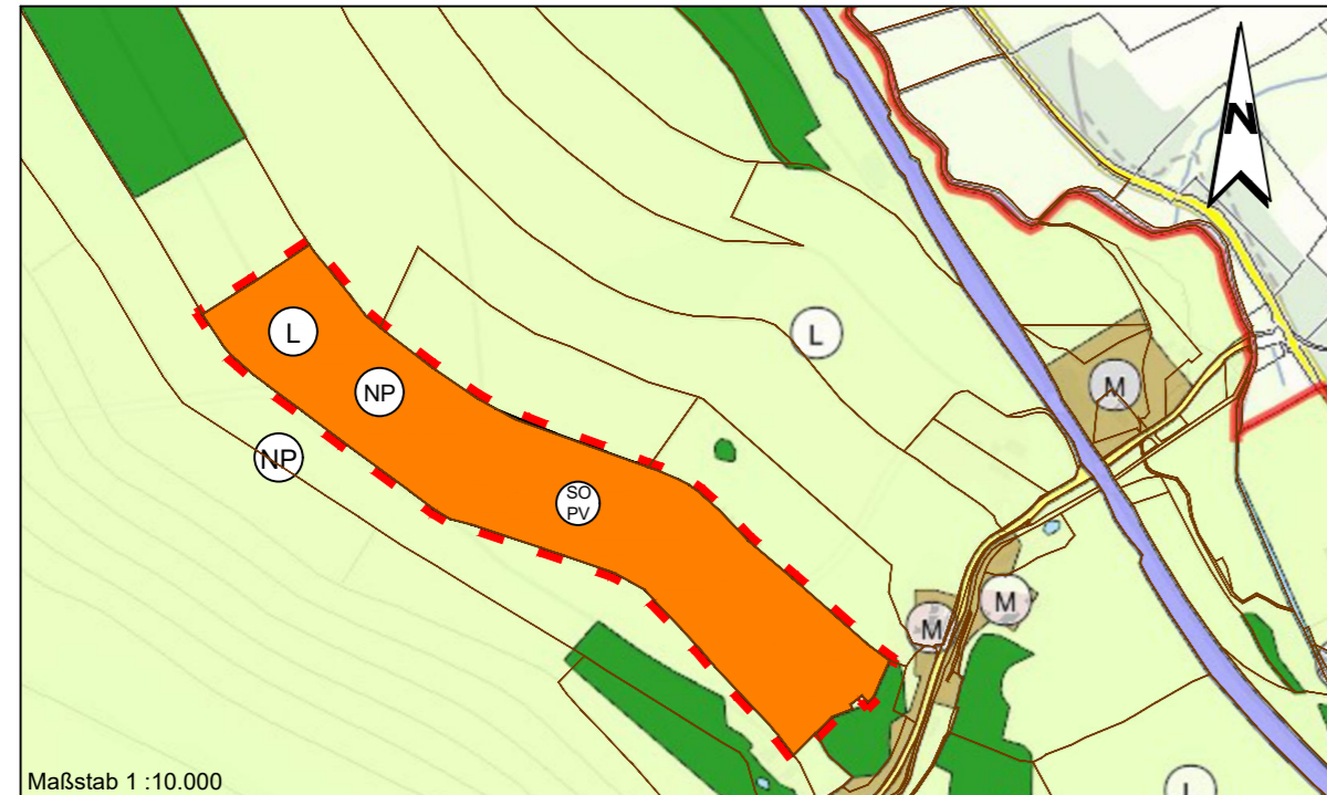
Maßstab 1 :10.000