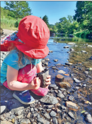
Bei einem genauen Blick ins Gewässer, kann man Vieles entdecken.

Diese Frage kann natürlich jeder beantworten: Fische! Sie fallen einem wohl als erstes ein. Aber was lebt dort eigentlich noch?