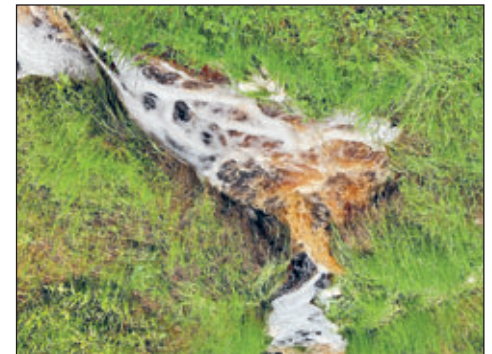
Eine natürliche Schaumbildung kommt beispielsweise bei Bächen aus Mooregebieten wie hier im Erzgebirge vor und ist nicht bedenklich.

Wenn Sie beim nächsten Spaziergang also Schaum auf einem Gewässer entdecken, können Sie nun etwas besser abschätzen, ob dieser natürlichen oder anthropogenen Ursprungs ist. Allerdings liegen oft auch Mischungen vor, die dies erschweren. Bei dringendem Verdacht auf eine Verunreinigung, können Sie diese gern an ihre zuständige untere Wasserbehörde melden.